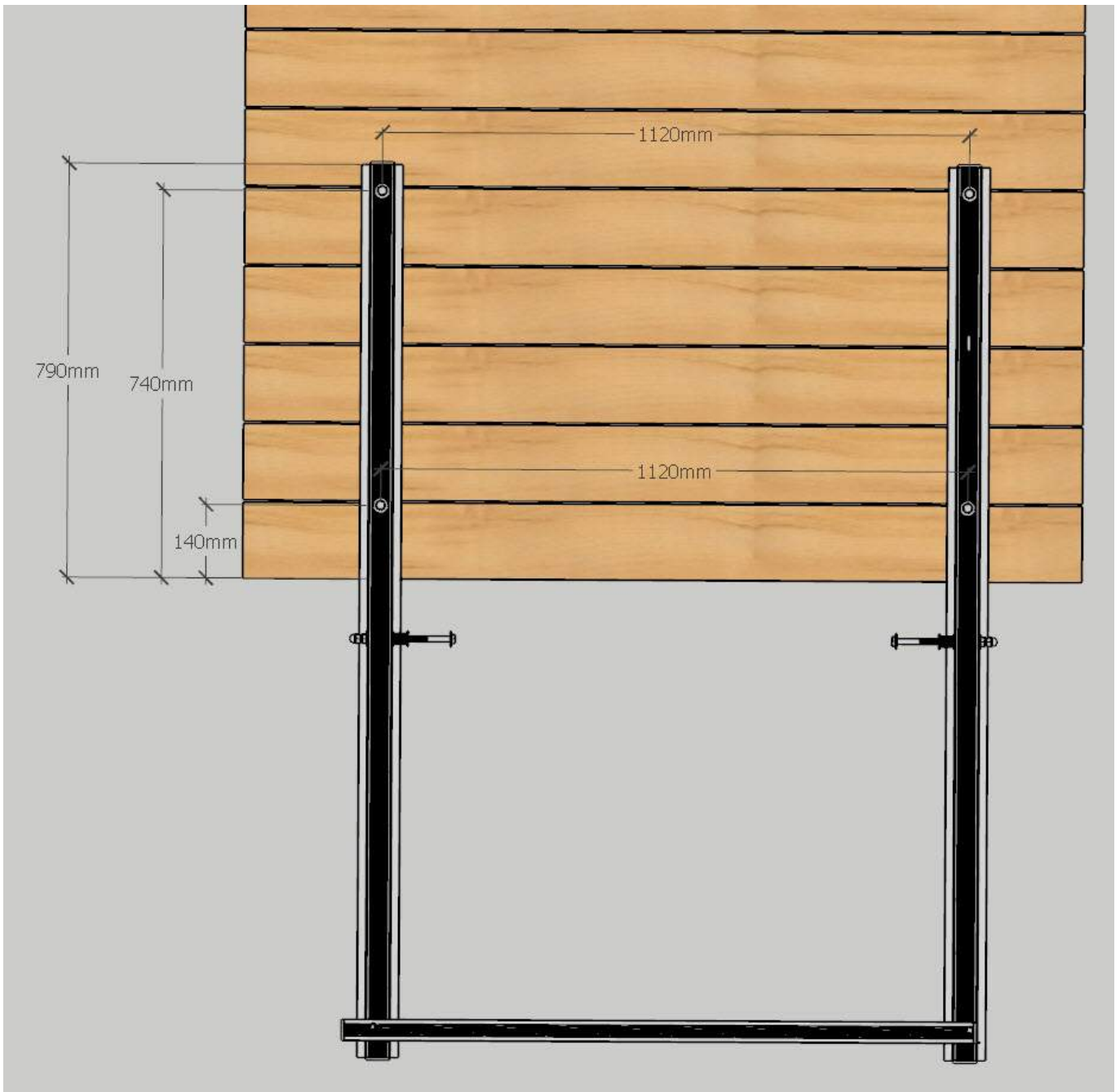
Kuva 2: Kuvassa pystyssä vaakatangot ja kuvan alareunassa poikittaistanko jonka varassa portaat lepäävät talven. Kuvassa mitat 85 cm leveille portaille. Vaihda mitat 65 ja 95 cm leveille portaille, yllä ohjeen kohta 1.