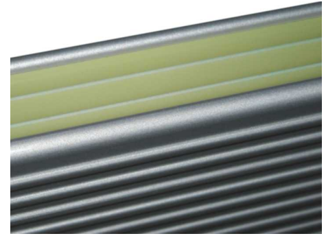
aluPatio elementin yläreuna ja ECOaurora hehkuvalo.